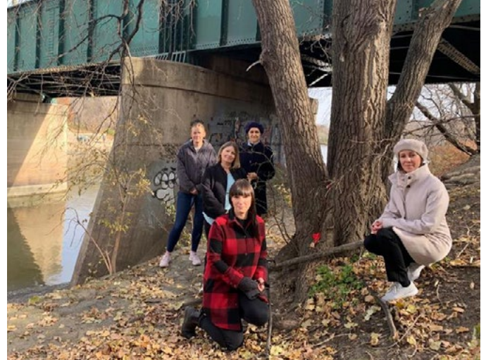
Des offrandes de tabac ont été placées sous un arbre près du pont qui mène à La Fourche, en commémoration de Chanie Wenjack, un garçon de 12 ans qui s'est enfui d'un pensionnat autochtone en 1966.